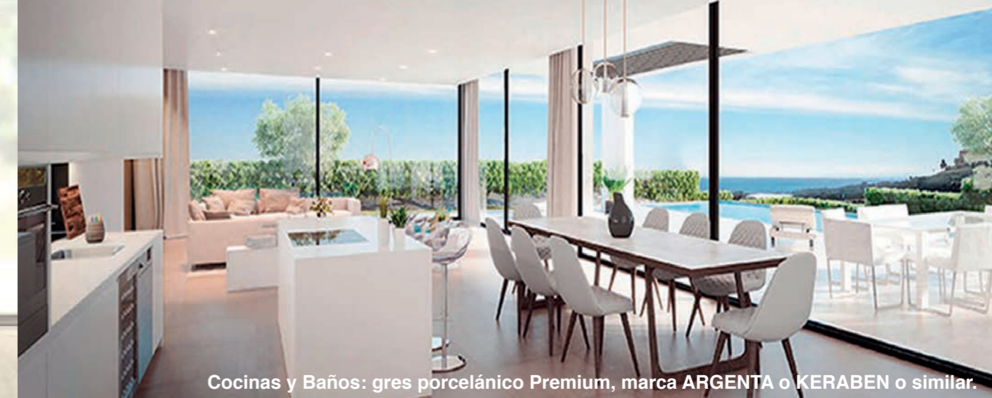
Cocinas y Baños: gres porcelánico Premium, marca ARGENTA o KERABEN o similar.

AERO-TÉRMICO VAILLANT, SAUNIER DUVAL o similar (energía renovable) sistema basado en agua instalado en todo el suelo y el primer piso.