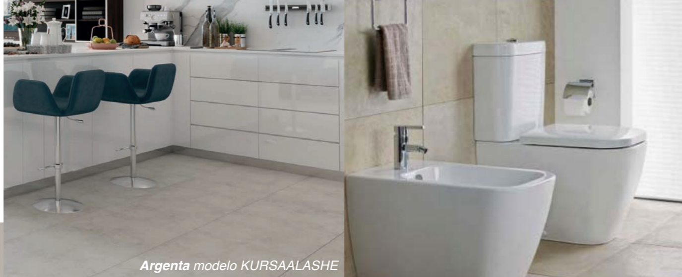
Argenta modelo KURSAALASHE